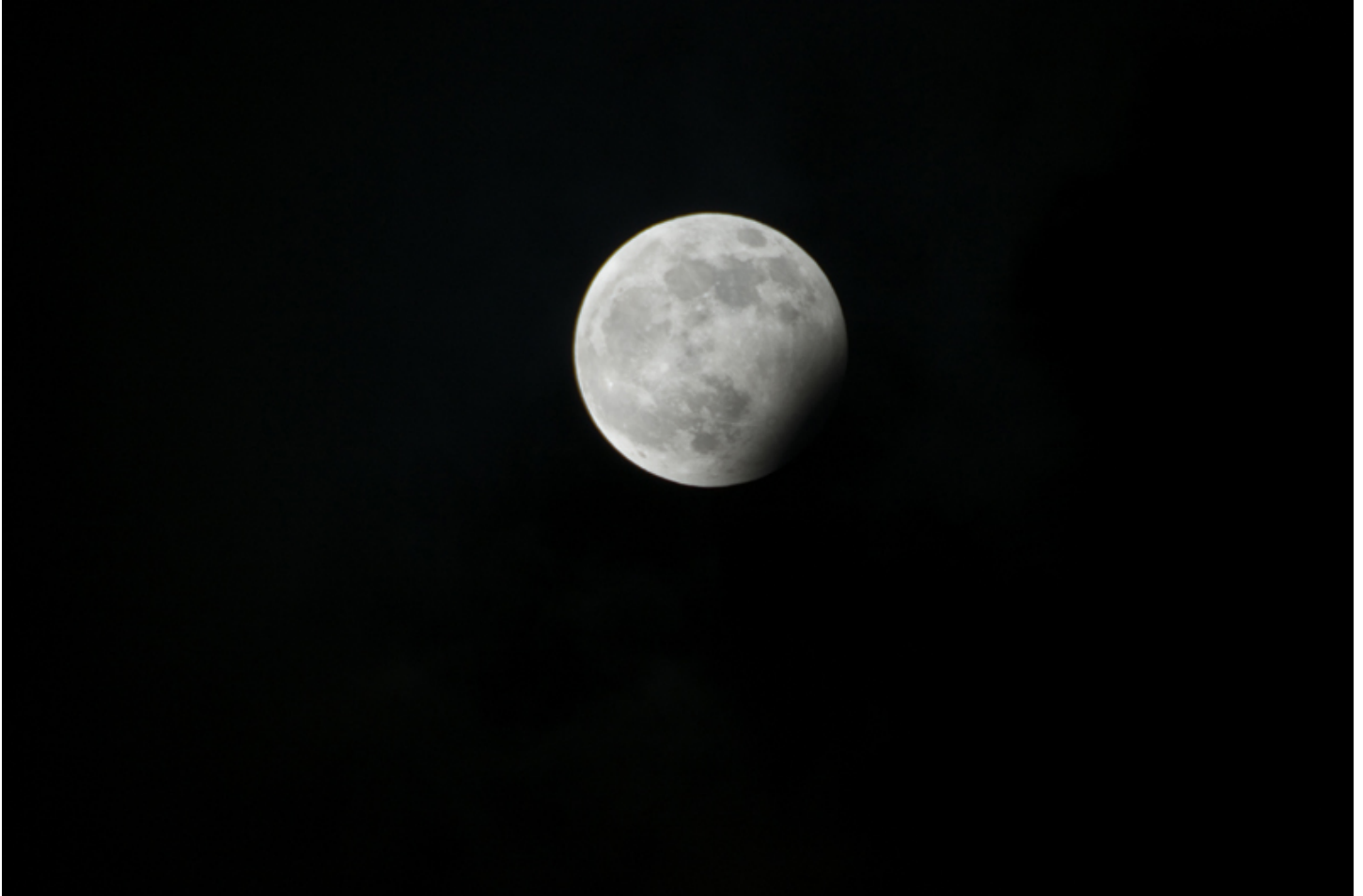
Bild vom 31.12.2009. Aufnahme um 20.16 Uhr MEZ in Schenkon, Nikon D-300 mit Sigma 170-500 Objektiv. 1/200 sec. Belichtungszeit; Blende 6.3. Unten rechts ist der Mond schön "angeknabbert"

Am Abend des letzten Tages des Jahres findet eine partielle Mondfinsternis statt.